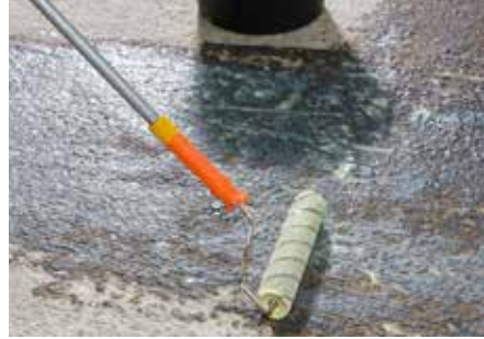
2 Grundierung mit KÖSTER SL Primer